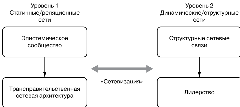
Рис. 1. Двухуровневая аналитическая рамка трансправительственного сетевого управления