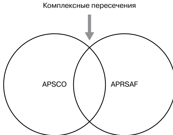
Рис. 3. Пересечение в конфигурации сети управления космическим пространством в Азии